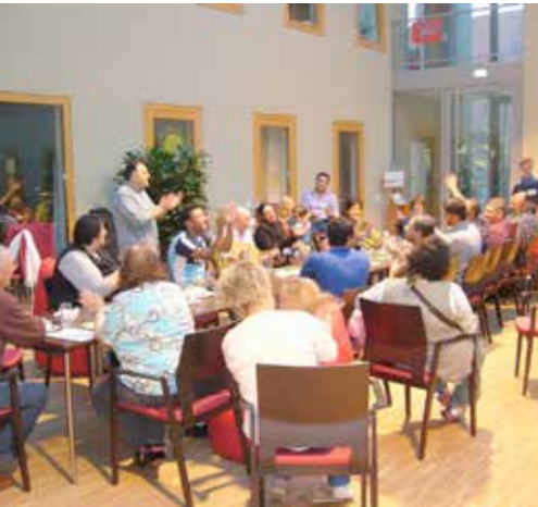
Begegnung zwischen syrischen Flüchtlingen und Einheimischen im Rahmen des Projekts von LIBa „Besser essen Mehr bewegen.“ Die Brückenbauer unterstützten die Veranstaltung vor Ort.

nen. Aufgrund der Vielzahl der Anfragen wurde ab dem 01. Januar 2016 das Projekt „SISA – Sprachmittlung in Sachsen-Anhalt“ ins Leben gerufen. Der im Jahr 2015 entstandene Sprachmittlungspool wird jetzt im Rahmen dieses Projekts betreut.