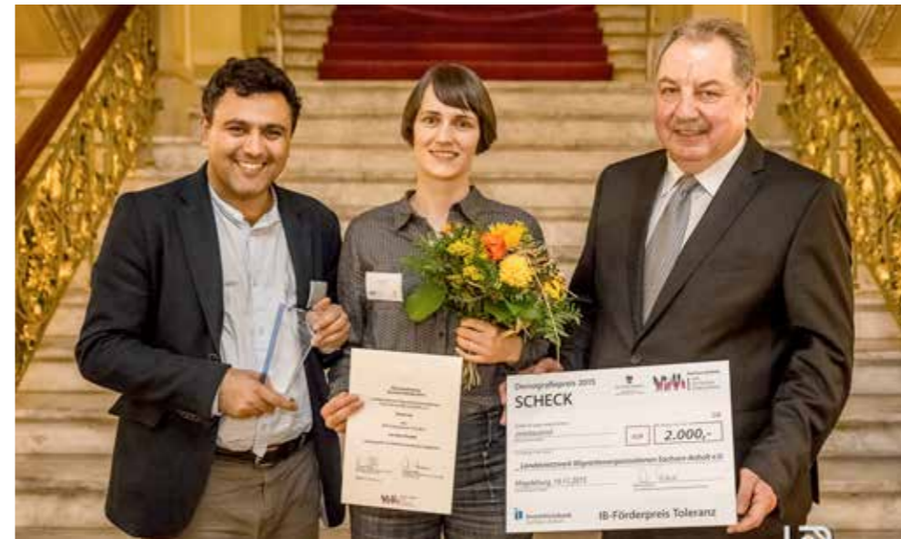
Das Projekt ist Preisträger des IB-Förderpreises Toleranz 2015. Demografiepreis des Landes Sachsen-Anhalt 2015